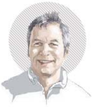
佛傑是獲獎的科普作家，也是《美國最佳科學與自然寫作叢書》的編輯。

高分的答案是「兩者都是水果」，後者的答案超越單純的物理性質。另一個類別由一些幾何圖案組成，圖案之間有某種抽象的關聯，受試者必須找出正確的關聯。