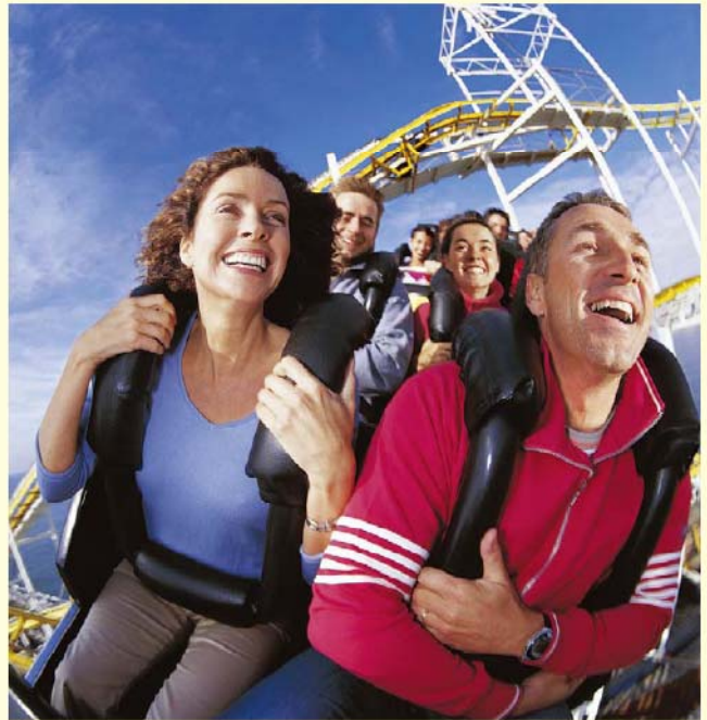
與另一半一起坐雲霄飛車或經歷其他驚險刺激的事件，可以藉由提高身體的興奮感，以及讓彼此覺得脆弱而幫助建立感情。

7 善意、容忍與寬恕： 許多研究都證實，人們比較容易與善良、敏感及體貼的人建立關係。若有人刻意改變行為（例如戒菸、戒酒等）來迎合我們的需要時，愛苗的滋生速度便會大為提升。寬恕往往能增進彼此的關係，原因是當一方原諒對方時，也會顯現出脆弱感。